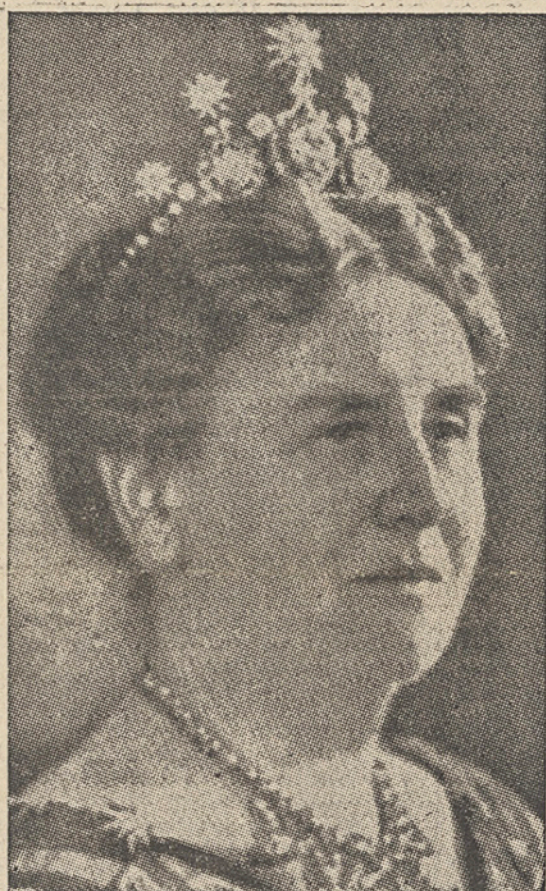
H.M. de Koningin, voor wie deze uren wel zeer in het bijzonder de grootste van Haar leven zijn.

Het geallieerde hoofdkwartier maakte gisteravond bekend: Alle Duitsche strijdkrachten in Noordwest-Duitschland, Nederland en Denemarken hebben zich overgegeven. Deze capitulatie omvat ook de Duitsche troepen op de Waddeneilanden en Helgoland en wordt Zaterdagmorgen om 8 uur van kracht. De Duitschers in Noorwegen vallen niet onder deze overgave.